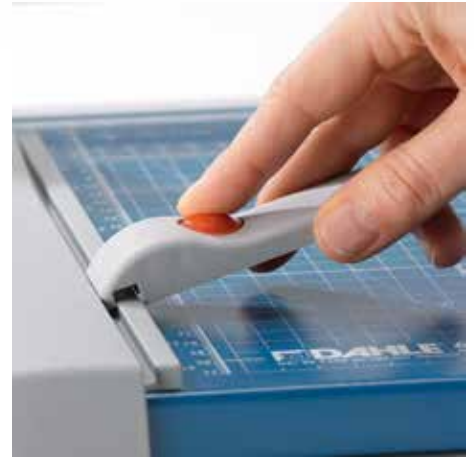
Tope posterior regulable para la detección rápida del formato, aplicable en ambos topes angulares