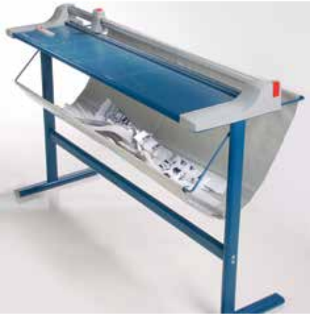
Sólido bastidor inferior con bandeja recolectora para una óptima altura de trabajo