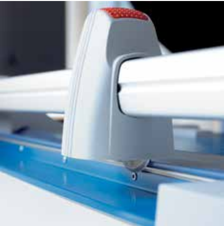
La cuchilla circular en el cabezal de plástico cerrado garantiza máxima seguridad