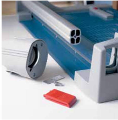
El cambio fácil del cabezal de corte permite un trabajo fluido