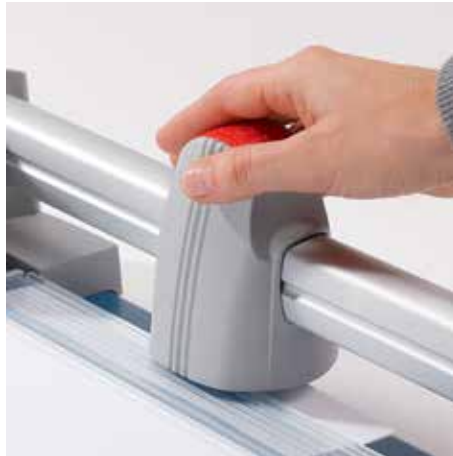
Cabezal para cortar ergonómico para un confortable manejo de la cizalla